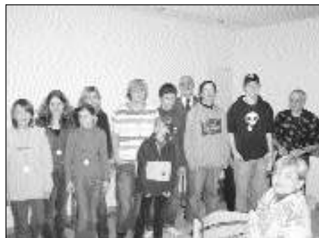
Der saarländische Kader

Last but not least möchten wir uns bei den Herbergseltern für die sehr gute Versorgung bedanken und natürlich bei allen TeilnehmerInnen für den disziplinierten Aufenthalt in den Räumen der Jugendherberge Saarbrücken.