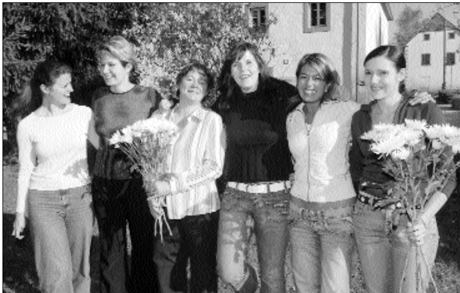
Die erfolgreiche Damenmannschaft der SF Wadgassen/Differten in der vergangenen Saison