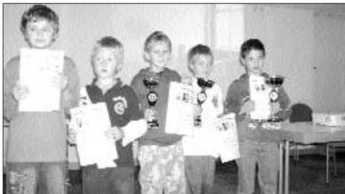
Die Gewinner der U10