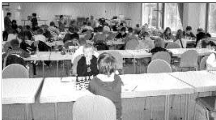
Blick in den Turniersaal