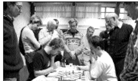
Saison 2005/06: kaum zu überbietende Spannung an Brett 4 (Illingen - Landau)

Alle Schachinteressierten sind natürlich herzlich eingeladen, vor Ort live und in Farbe dabei zu sein! H.R.