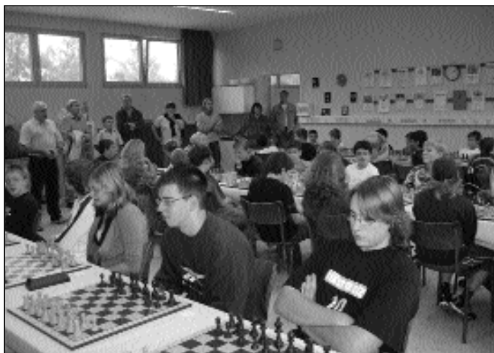
Ein Blick in den Turniersaal, der Grundschule in Elm-Sprengen