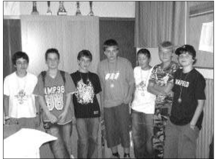
Die weiteren Teilnehmer in der U14, welche mit Teilnahmemedaillen ausgezeichnet wurden.