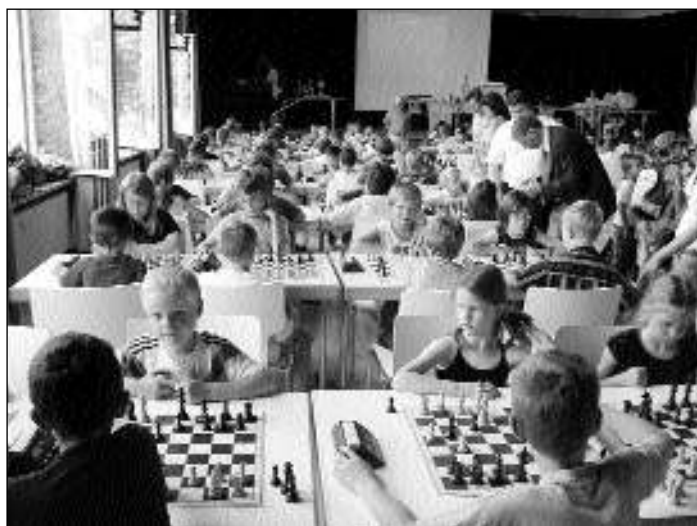
Volles Haus bei der Bezirks-Schulschach-Mannschaftsmeisterschaft

Die drei Themenhefte, mit denen ich ständig arbeite, seitdem ich sie vor Monaten - reichlich spät, zugegeben - entdeckt habe. «Denn die verstecken sich