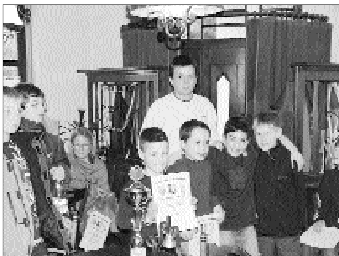
Platz 3 der 1. Liga U12: SVg Saarbrücken IV