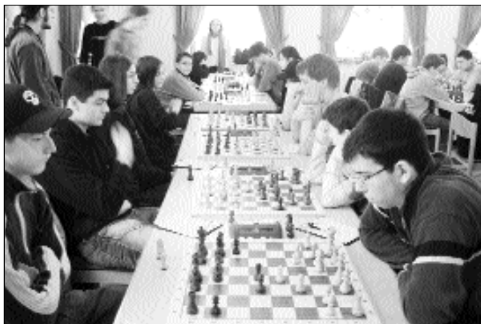
Saarbrücken II (links) gegen Schwalbach