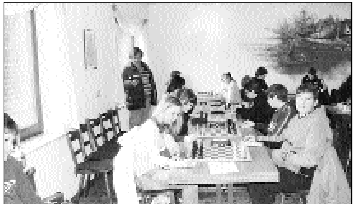
Das Spiel der Spiele am letzten Spieltag in der U20: Wadgassen - Schiffweiler