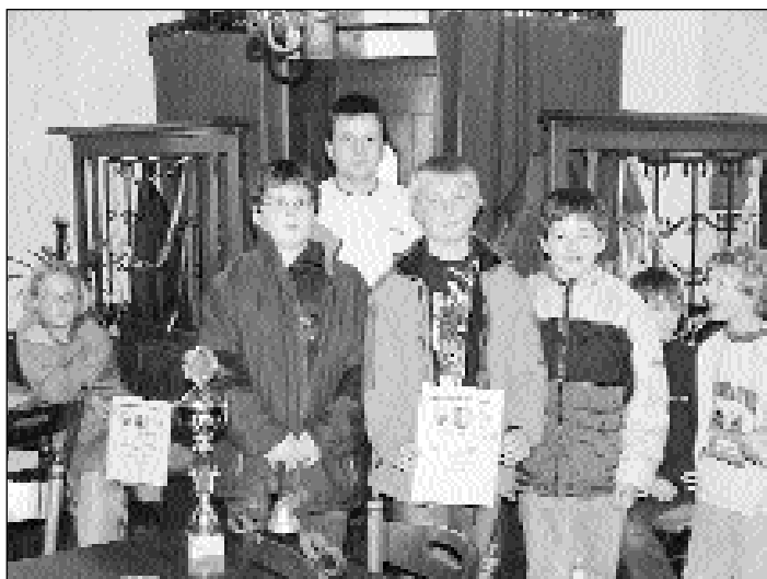
2. Platz 1. Liga U12 Heusweiler 8

Ebenso spannend ging es im Tabellenkeller zu, wo Eppelborn 2, Ostertal 3 und Rochade Saarlouis 4 um den begehrten 6. Platz (letzter Nichtabstiegsplatz) kämpften. Für Rochade Saarlouis war auf Grund des schlechten Brettverhältnisses der Abstieg unvermeidlich. Eppelborn 2 musste schon frühzeitig gegen Heusweiler 7 eine 3:1 Niederlage hinnehmen wonach gespannt dem Ergebnis Heusweiler 6 - Ostertal 3 entgegen gefiebert wurde. Heusweiler, für die es um nichts mehr ging konnte allerdings klar mit 4:0 die Partie für sich entscheiden, wodurch Eppelborn gerettet war.