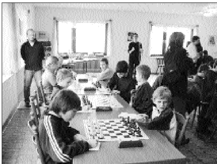
Heusweiler 7 - Eppelborn

In der 1. Liga der U12 Nachwuchsklasse stand die Meisterschaft für Heusweiler 7 bereits nach dem 6. Spieltag fest. Ihnen gelang es ebenfalls mit lediglich einem Gegenpunkt gegen SVg Saarbrücken ungeschlagen zu bleiben.