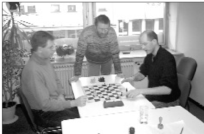
Mitte stehend: Joachim Löw