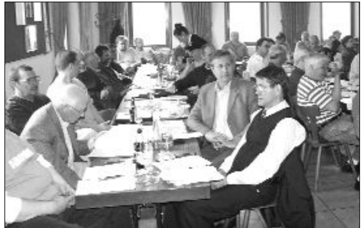
Volles Haus: Die GV am 23.04. in Dudweiler