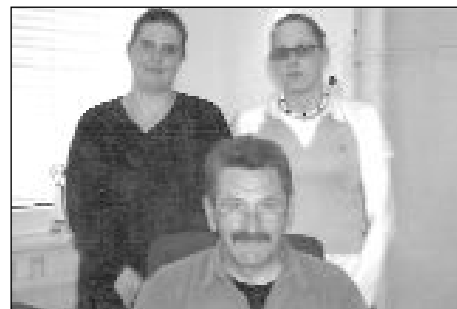
Happy Birthday am 3. Juni!

Leistungssportler/Innen, die durch den LSVS das Privileg genießen dürfen, Training und Praktikum miteinander verbinden zu können.